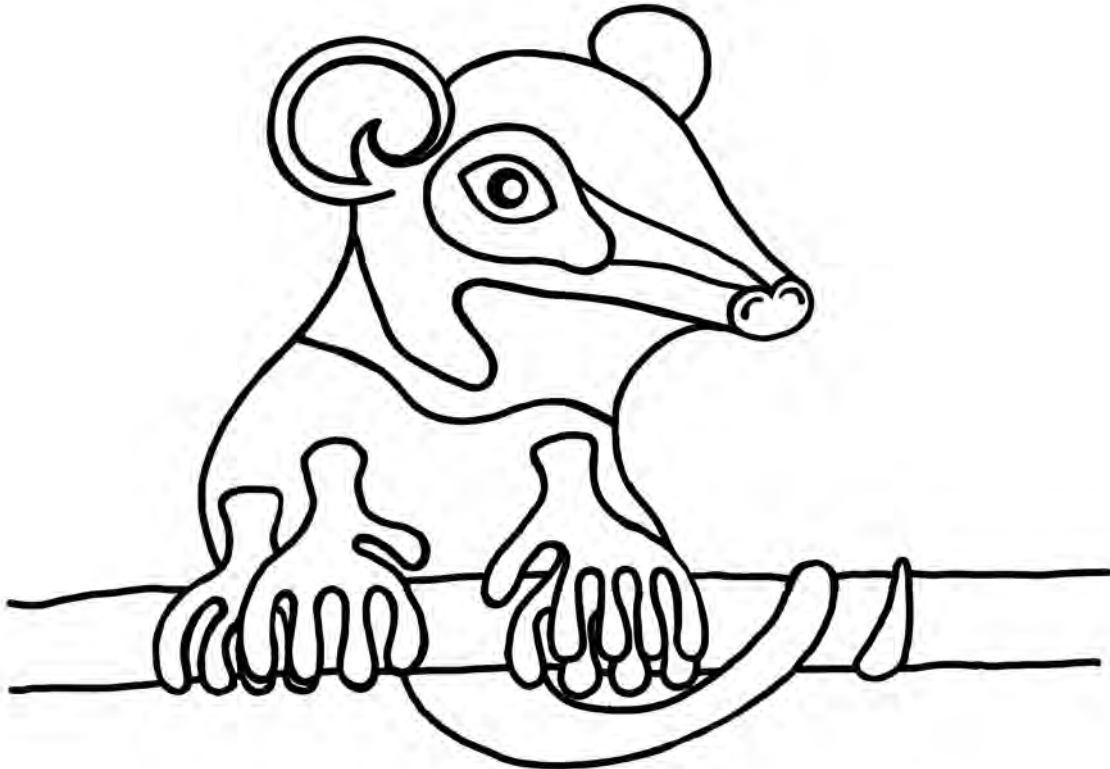
Parque Nacional Nahuel Huapi