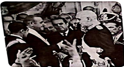
Durante su asunción, Héctor Cámpora saluda a Alejandro Lanusse, el 25 de mayo de 1973.

Al movimiento de resistencia se sumó la acción de algunos grupos armados, algunos peronistas (Montoneros, Fuerzas Armadas Peronistas, entre otros), algunos marxistas (Ejército Revolucionario del Pueblo). Estas agrupaciones no surgieron en forma aislada, pues la revolución socialista que triunfó en Cuba en 1959 inspiró a varios movimientos políticos y armados en todo el mundo y, en particular, en América latina.