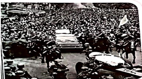
Una multitud despidió los restos de Juan Domingo Perón, quien murió el 1° de julio de 1974.

Isabel no tenía habilidad política para hacerse cargo de un país atravesado por intensos conflictos. Su gobierno cobijó* la actuación de la Triple A (Alianza Anticomunista Argentina), una organización parapolicial* que perseguía a guerrilleros y políticos, y que fue responsable de muchos asesinatos e intimidaciones. El 24 de marzo de 1976, un nuevo golpe militar terminó con su gobierno.