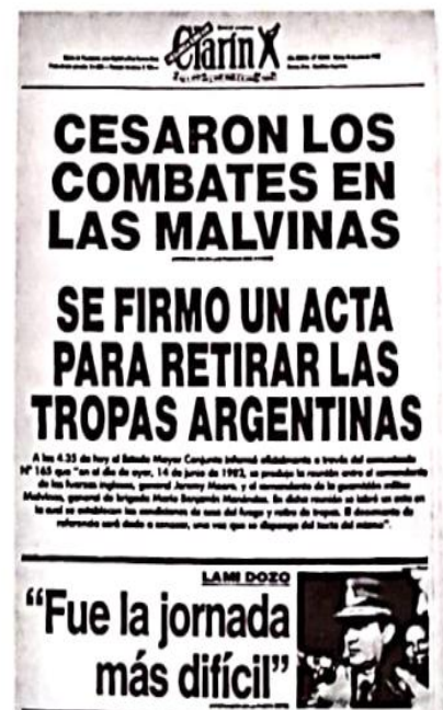
Portada del diario Clarín con el anuncio de la rendición de los militares argentinos en las islas Malvinas.